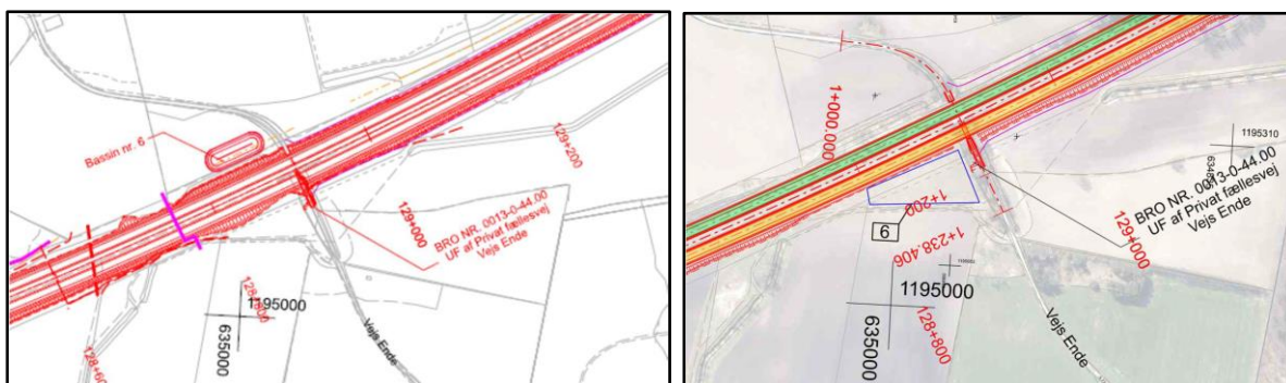
Figur 3: Til venstre: Den tidligere godkendte placering af regnvandsbassin 6. Til højre: Den anmeldte ændring