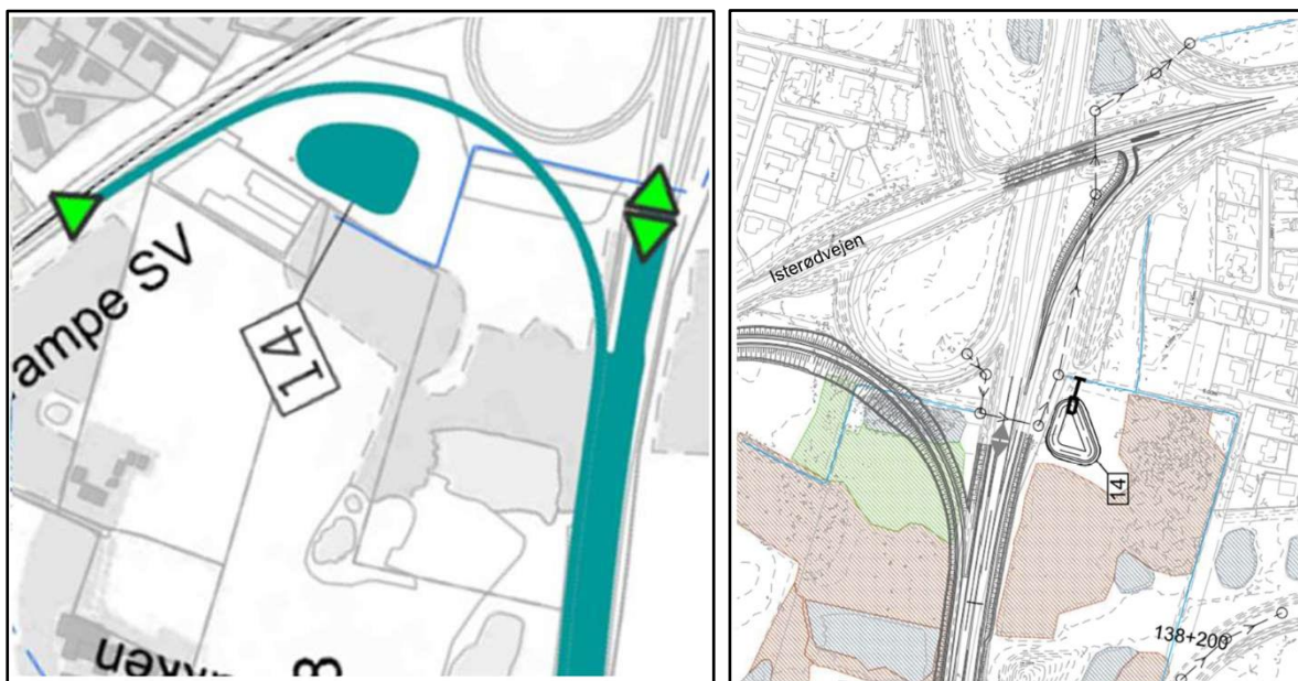
Figur 2: Til venstre: Den tidligere godkendte placering af regnvandsbassin 14. Til højre: Den anmeldte ændring