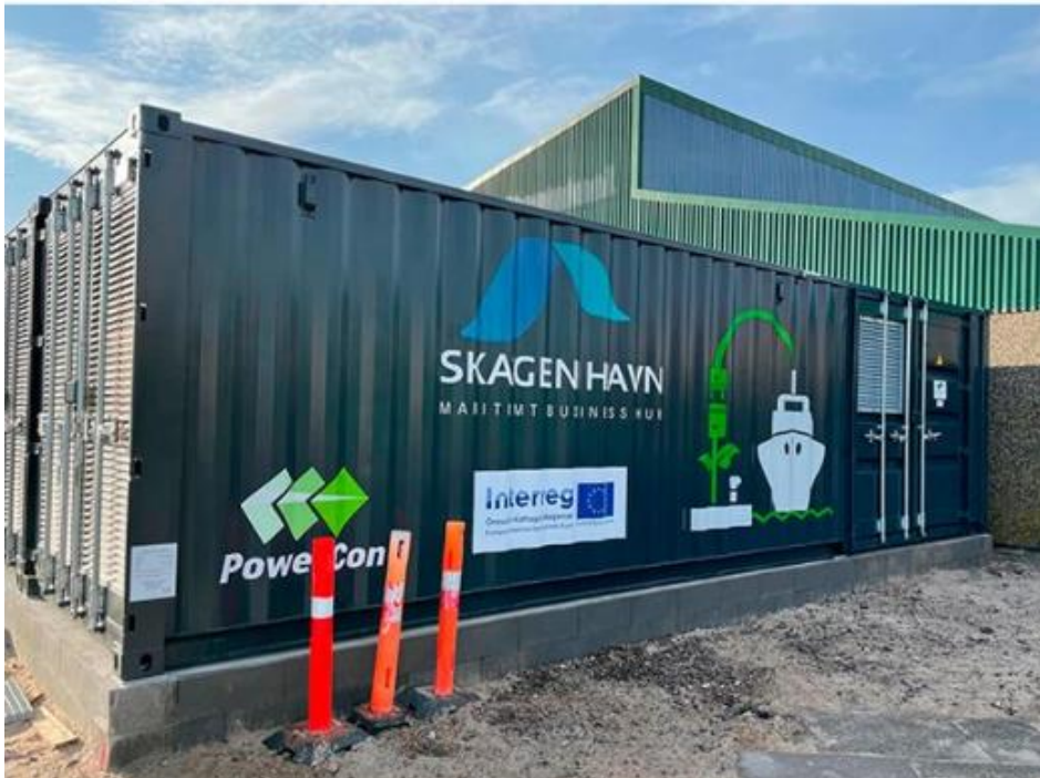
Figur 3 Eksempel på konverter-container

Eksisterende vejadgang fra Fabrikvej til havneområdet benyttes. Der ønskes mulighed for oplag på arealerne.