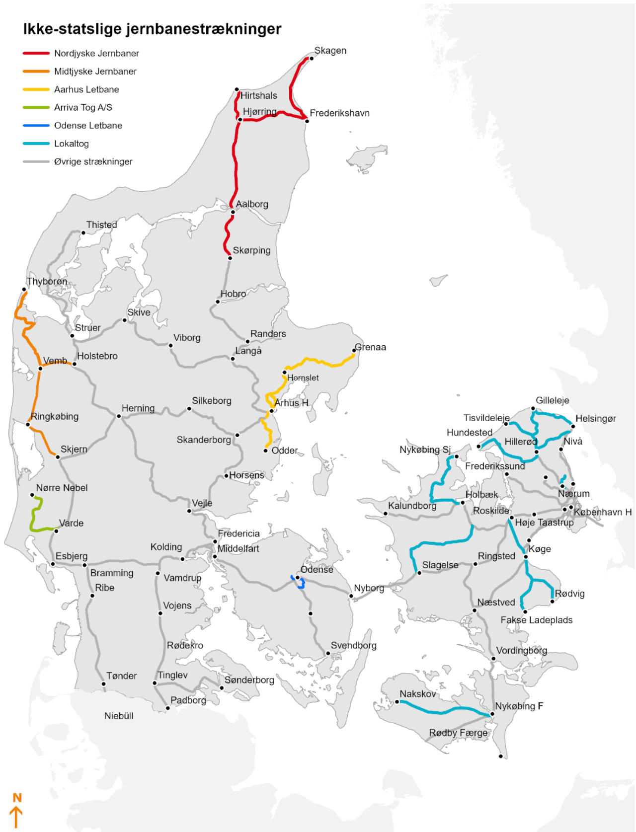
Figur 1. Togoperatører på ikke-statslige jernbanestrækninger, 2023