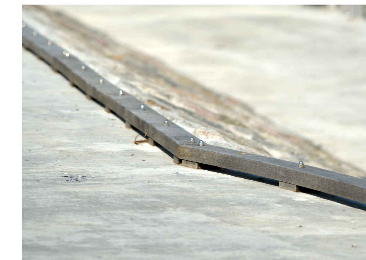
Referencebillede kantbræt, oplodset

Tegnings nr: SLUS BRYGGE_K02_H4_T01_E00_0001 Revisión: