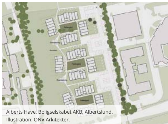
Alberts Have, Boligselskabet AKB, Albertslund. Illustration: ONV Arkitekter.

Første fase af forsøgsprojektet AlmenBolig+ kørte fra 2007 - 2015. Konceptet indebærer en række forsøgs-elementer, som i 2007 blev godkendt af det daværende Socialministerium.