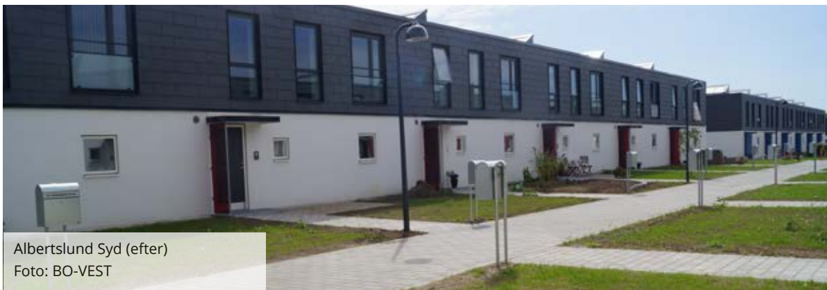
Albertslund Syd (efter)

De bydende havde adgang til al viden omkring bebyggelsen, og de skulle således svare med løsninger og kvalite-