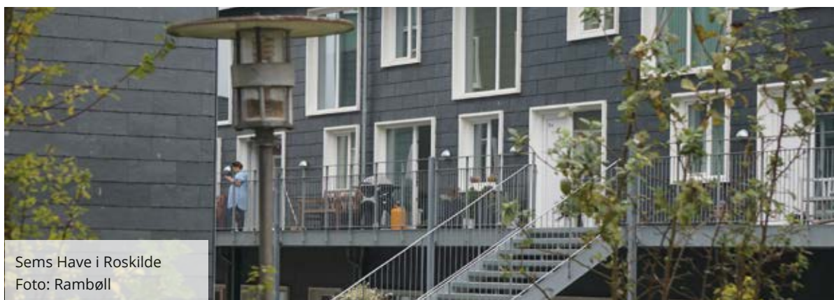
Sems Have i Roskilde

I første omgang har man sikret sig en vifte af gode samarbejdspartnere, som kan løse alle slags opgaver. Ved mini-udbuddene skal der så fokuseres på at finde netop den rådgiver, der passer bedst til den konkrete opgave.