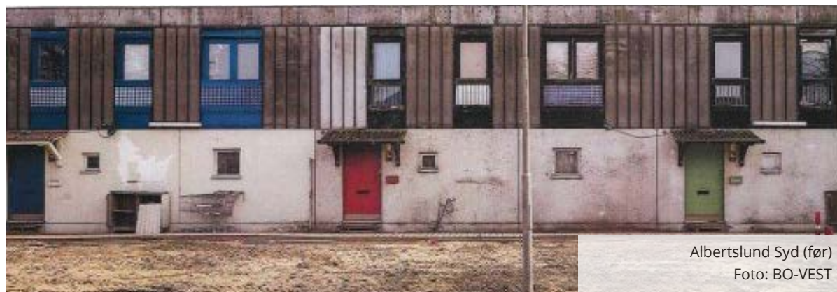
Albertslund Syd (før)