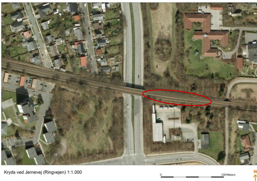
Figur 1: Eksempel på stationens placering øst for Jernevej

Jerne station kan placeres der, hvor jernbanen krydser Jernevej. Jernevej er en 4-sporet vej, med to kørebaner i hver retning. Der er cykelsti og fortov i begge sider. Jernevej har en del trafik. Der kører ikke busser på denne del af Jernevej i dag. Området er busbetjent via Randersvej.